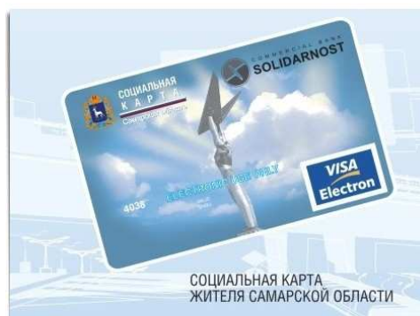
Рис. 3. Социальная карта жителя Самарской области

Посредством социальной карты (рис. 3) сельские жители Самарской области могут значительно экономить свое личное время при записи на прием в офисе врача общей практики. Благодаря специально разработанной системе (АИС «ВОП») медицинские работники еще в момент записи человека на прием могут уточнить его персональные данные: проверить достоверность информации о пациенте, которая хранится в базе данных, получить сведения о его последнем прохождении флюорографии и онкоосмотра, а также проверить наличие амбулаторной карты.